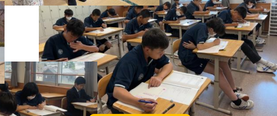
英検 & 漢検