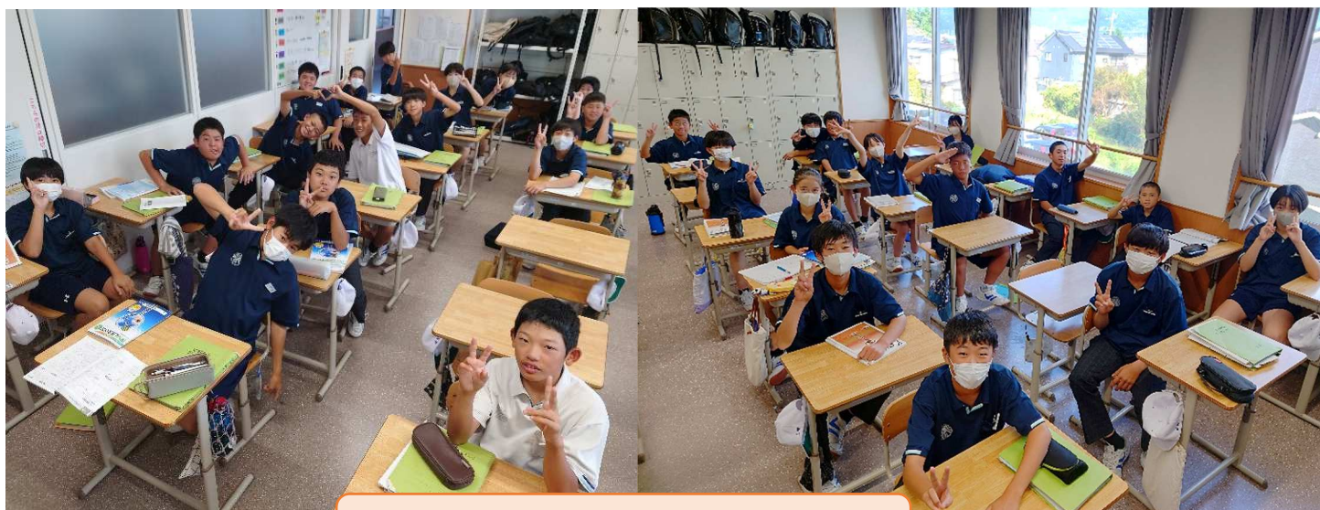
後半スタートの第1日目！ 10月1日(火)