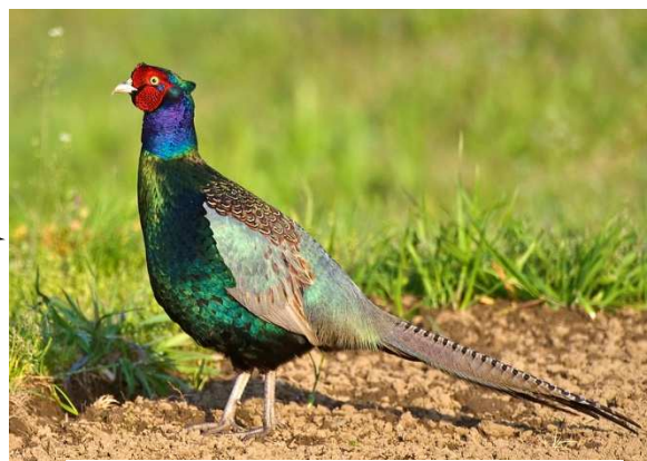
Japanese green pheasant