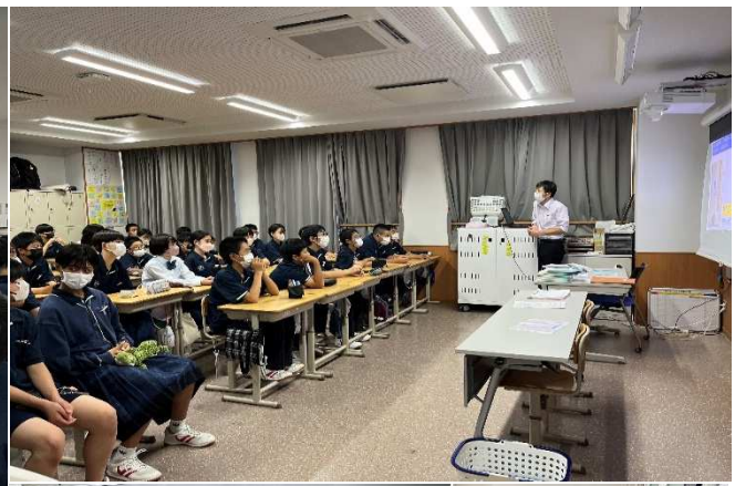
班で行先について話し合っています