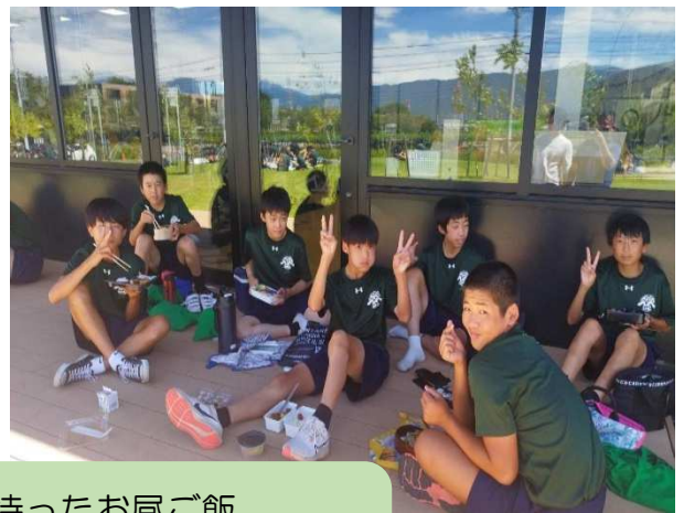
待ちに待ったお昼ご飯 外でのお弁当美味しかったね～