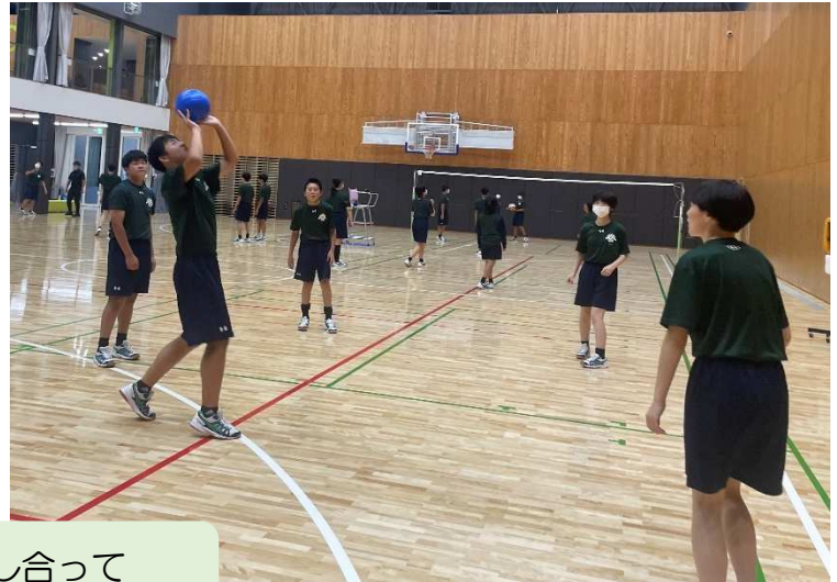
互いに声を掛け合い，励まし合って